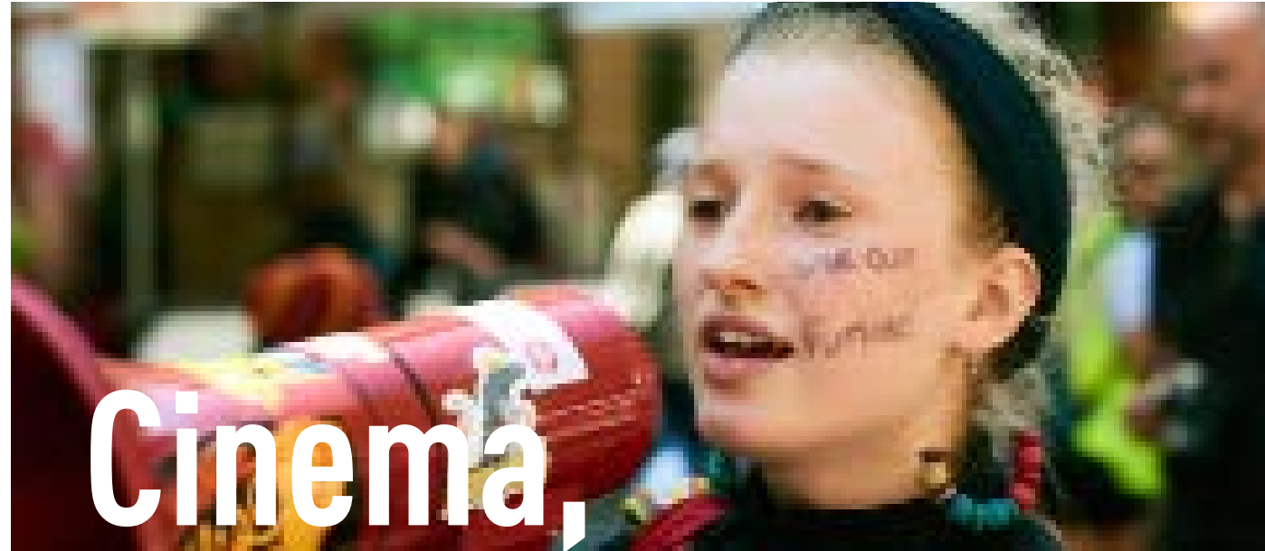
Wild Things by Sally Ingleton