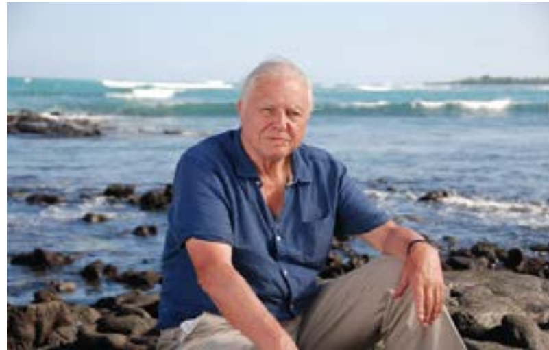
Great Barrier Reef by David Attenborough